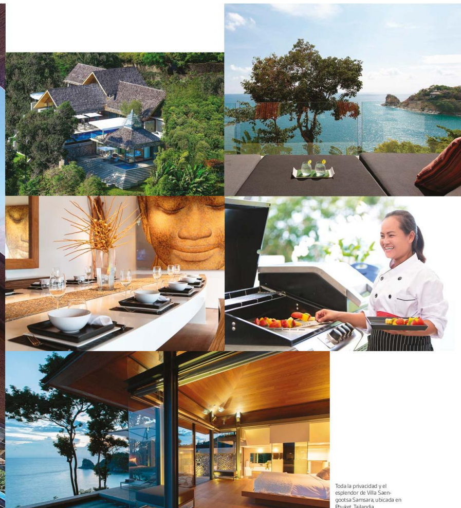
Toda la privacidad y el esplendor de Villa Saengootsa Samsara, ubicada en Phuket, Tailandia.

TEXTO: TEXTO: ULISES COHEN.